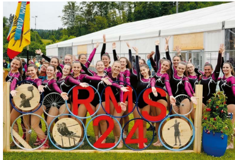
Gruppenfoto Barrensektion, RMS 2024 Turbenthal

Mit grossem Einsatz der gesamten Turnfamilie wurde 2017 die Regionalmeisterschaft in Wülflingen durchgeführt. Ein Jahr später entstand mit dem Wülflinger Turntag ein Wettkampf für die Jugend, der sich dank viel Engagement als fester Bestandteil im Jahresprogramm etabliert hat. Besonders hervorzuheben ist dabei, dass die gesamte Mädchenriege – und damit auch Anlässe wie der Wülflinger Turntag – von engagierten DTV-Mitgliedern organisiert und geleitet wird, die sich zusätzlich als Leiterinnen einsetzen. Dass der DTV auch im Dorfleben aktiv ist, zeigte sich unter anderem 2019 mit einer Gymnastikdarbietung an der 1.-August-Feier auf dem Taggenberg. Zuletzt stellte sich der Verein 2025 am Chläggi-Cup einer neuen sportlichen Herausforderung.