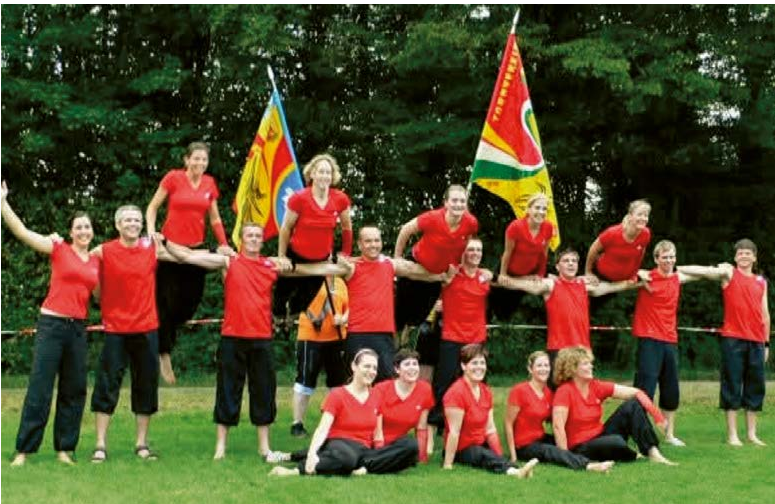
Gruppenfoto Gymnastik mit TV am ETF Frauenfeld, 2007

Im gleichen Jahr kam die erste Vereinsfahne zum Einsatz. Fahnen haben in Turnvereinen eine lange Tradition. Sie stehen für Identität, Zusammenhalt und Vereinsstolz und begleiten Umzüge, Turnfeste, Hochzeiten oder Jubiläen.