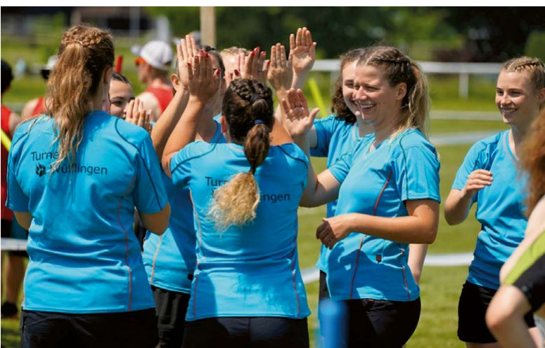
Gruppenfoto Fachtest, Turnfest Seeruggen 2016

Am Kantonalen Turnfest 1993 in Pfungen erreichte der DTV den 2. Platz im Korbball. Auch in den darauffolgenden Jahren blieb der Damenturnverein aktiv im Wettkampfgeschehen und gleichzeitig stark im Dorfleben verankert – unter anderem durch die Teilnahme an der Dorfet.