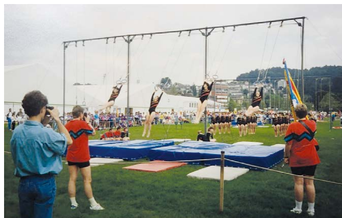
Schaukelring, ETF Luzern 1991

Auch sportlich setzte der Verein immer wieder Ausrufezeichen. Am Frauenturntag in Genf gelang 1978 der 1. Rang in der Hauptkategorie. Wenige Jahre später ein weiterer Erfolg: am Verbands-turnfest Cholfirst in Gymnastik und Geräteturnen in der 1. Stärkeklasse und am Seeländischen Turnfest 1990 durften sich die Teilnehmerinnen gar als Turnfestsiegerinnen feiern lassen. Im Jahresbericht wurde in diesem Zusammenhang liebevoll von einer «roten Invasion» gesprochen – eine Anspielung auf die neuen Vereinstrainer. Das Jahr danach wurde gleich in mehrfacher Hinsicht zu einem Meilenstein. An den Verbandsmeister-schaften in Weisslingen erreichte der Verein den 1. Rang an den Schaukelringen mit der Note 8.27. Gleichzeitig trat der Damenturnverein am Eidgenössischen Turnfest in Luzern mit 40 Turnerinnen, als einziger Verein dieser Grösse, zur Gymnastikvor-führung an. Da das vorgesehene Feld zu klein war, fand die Vorführung auf dem Rasen des Fussballstadions Allmend statt.