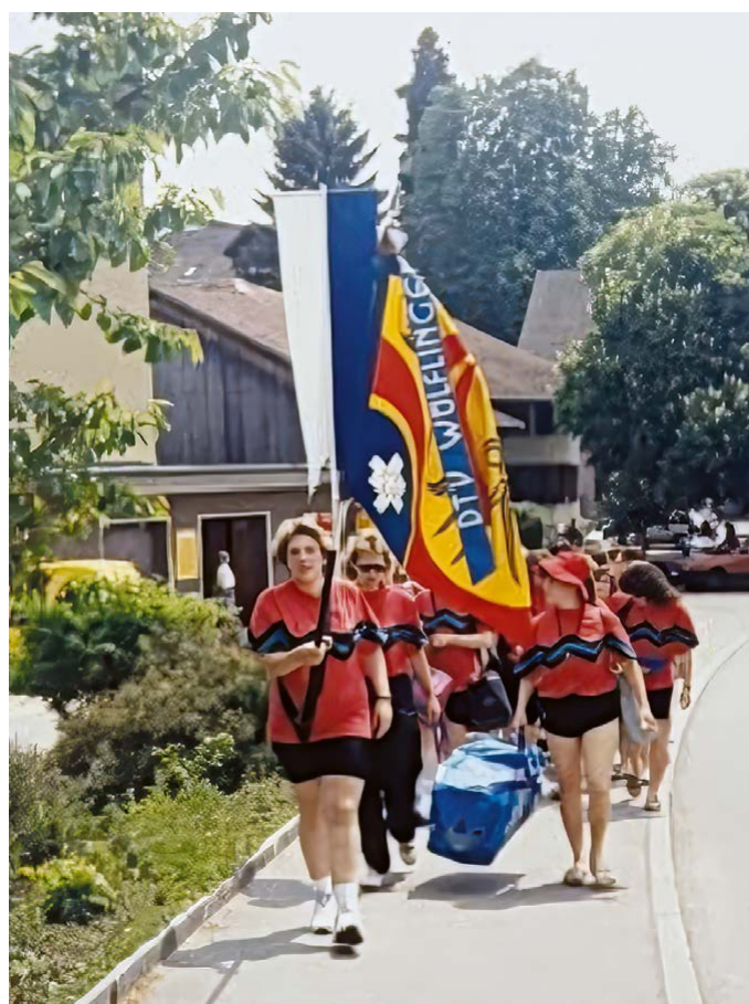
Erster Einsatz der Vereinsfahne, Verbandsfest Weisslingen 1991

Die Wurzeln des Vereins reichen bis ins Jahr 1909 zurück. Damals entstand im Turnverein Wülflingen der Wunsch, auch den Turnerinnen eine eigene organisatorische Heimat zu geben. Drei Jahre später wurde die Damenriege offiziell gegründet. Bereits kurz darauf, im Jahr 1913, verabschiedete man die ersten Statuten, und schon 1914 traten die ersten Passivmitglieder bei.